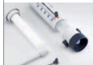
Gemakkelijk te reinigen